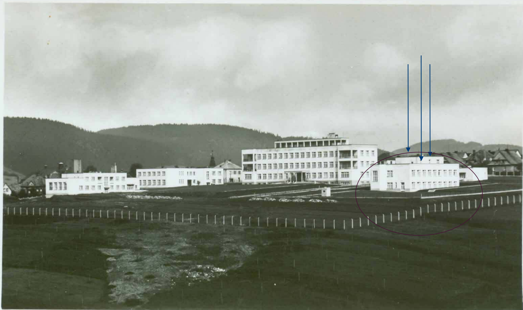
Okresní nemocnice v Olštíně n. Orlicí